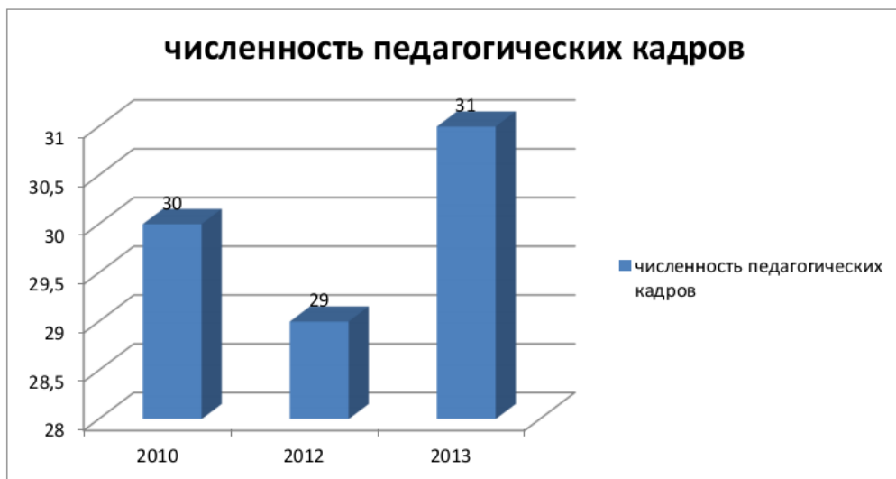
Рис. 2. Динамика численности педагогического состава школы