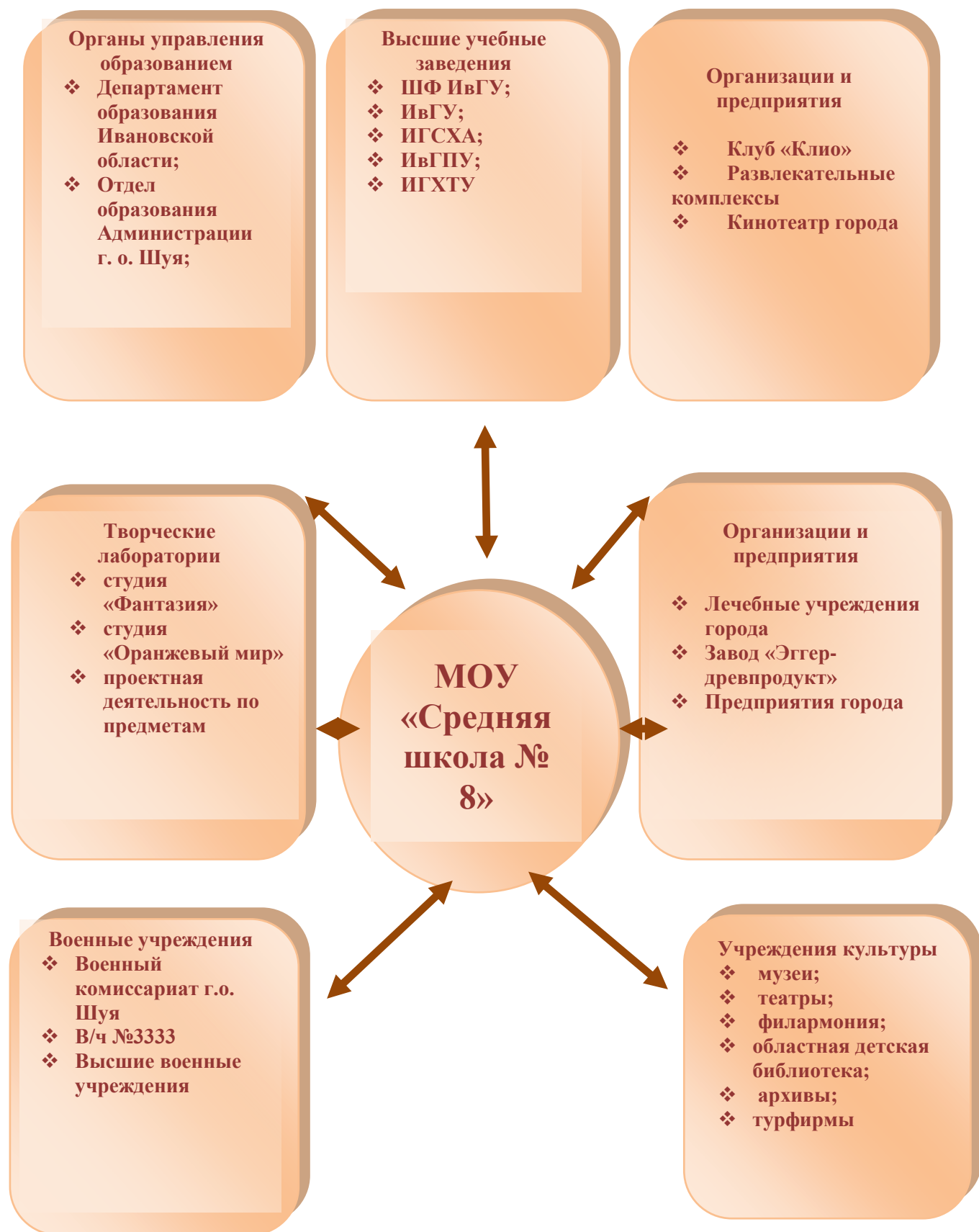
Схема взаимодействия МОУ «Средняя школа № 8» с учреждениями г.о. Шуя